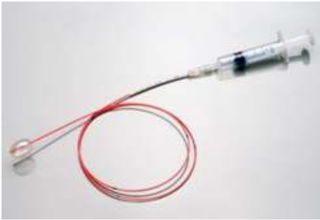
Figura 3 Catéter de Fogarty.

Compresión con balón del ganglio de Gasser: el procedimiento consiste en introducir un catéter de Fogarty (fig. 3) número 4 a través de una aguja canulada tipo Tuohy o una aguja de biopsia. Bajo anestesia general, no requiere la cooperación del paciente, se realiza la punción y se introduce el catéter en el foramen oval. La punta del catéter se deja 1 cm por detrás del cavum de Meckel y se insufla el balón con 0,5-1 mL de contraste radiológico al 50%, para poder ser visualizado con radioscopia intraoperatoria. El balón debe adquirir una forma de pera una vez hinchado, y se mantiene entre 2 y 3 min, aunque este tiempo es muy variable entre diferentes autores 6 . Proporciona unas tasas de alivio sintomático inicial del 91-94% 44 , y a los 3 años la recurrencia puede ser hasta del 56% 40 . En cuanto a los efectos adversos, se notifican complicaciones como disestesias en más del 20% e hipoestesia hasta en el 57% 45 .